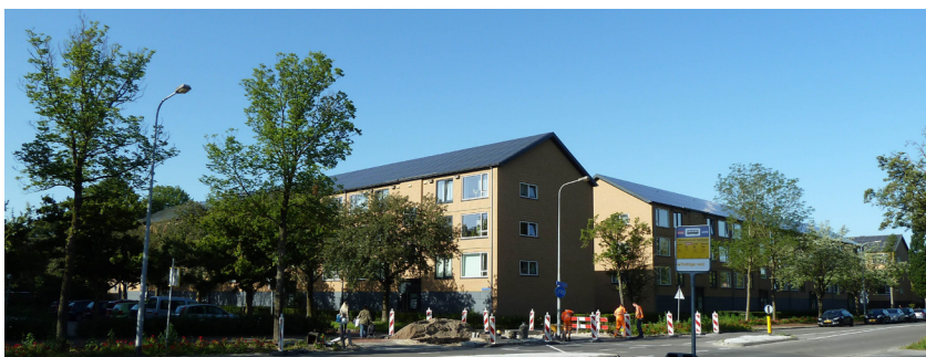
Zonnepanelen Pleidenlaan, Groningen