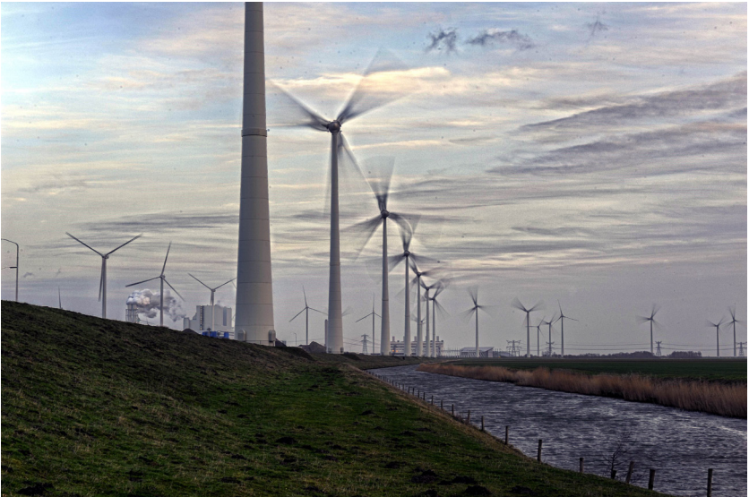
Windmolens Eemshaven.