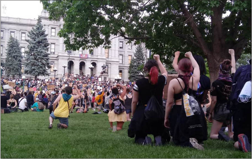
Denver: Black Lives Matter demonstratie

Toen ik vier jaar geleden vertrok uit Groningen om in de V.S. te gaan werken, legde ik in een interview in de Wenakker uit dat het credo ‘vechten voor wat kwetsbaar is’ me bij GroenLinks deed belanden toen ik voor het eerst mocht stemmen. Het vraagt van ons dat we ons solidair opstellen met anderen en dat we onszelf als onderdeel zien van een systeem; dat we oog hebben voor de effecten van ons individuele handelen en ons geluk en gemak afwegen tegen het welbevinden van de maatschappij, de natuur, de wereld. Soms hebben we als GroenLinkers debatten om te verkennen hoe dat te doen, soms zijn er daarover meerdere meningen binnen de partij.